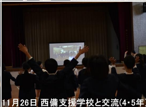
11月26日 西備支援学校と交流(4・5年)