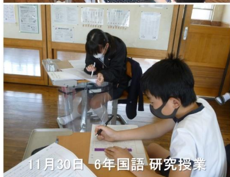
11月30日 6年国語 研究授業