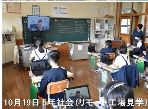
10月19日 5年社会(リモート工場見学)