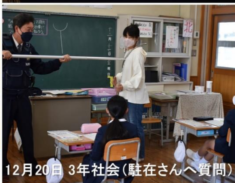
12月20日 3年社会(駐在さんへ質問)