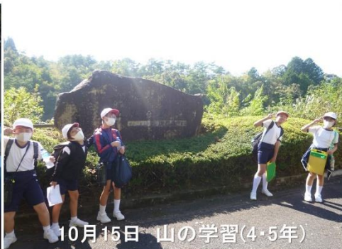
10月15日 山の学習(4・5年)