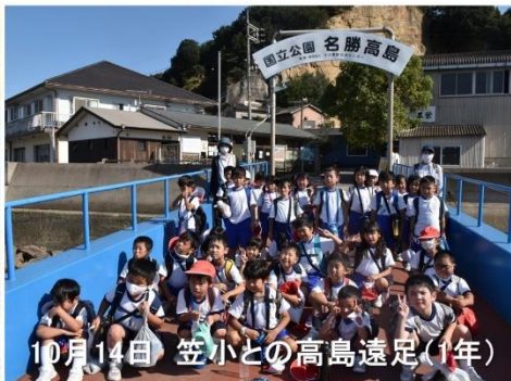
10月14日 笠小との高島遠足(1年)